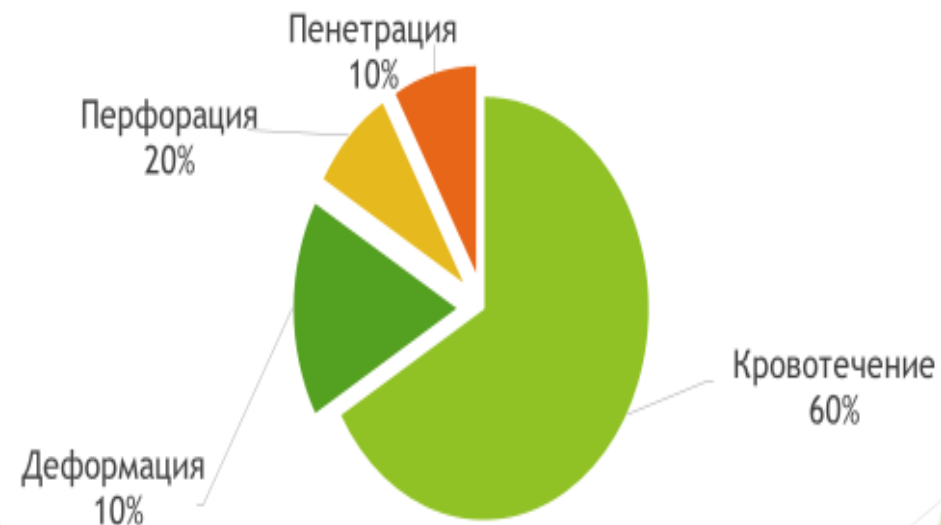
Осложнения язвенной болезни желудка и двенадцатиперстной кишки